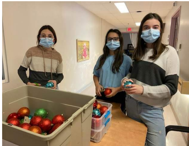
Trois Léo des Draveurs en action.

Nous avons officiellement un nouveau Club Leo dans notre District du U-2 ayant reçu leur charte officiellement le 30 janvier dernier, mais qui avait commencé leurs activités de bienfaisance depuis octobre dernier.